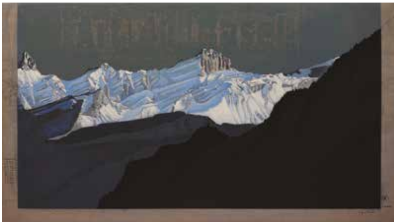
Petit Muveran et Dent Favre 2.11.2020 - 4.11.2021 Crayon et acrylique sur toile écrue 69 x 123 cm