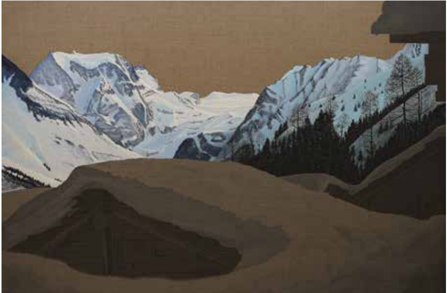
Les toits du Louché 28.02.2021- 12.11.2021 Crayon et acrylique sur toile écru 90 x 135 cm