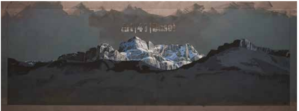
Les Cornettes de Bise 18.06 - 27.11.2020 Crayon et acrylique sur toile écru 75 x 200 cm