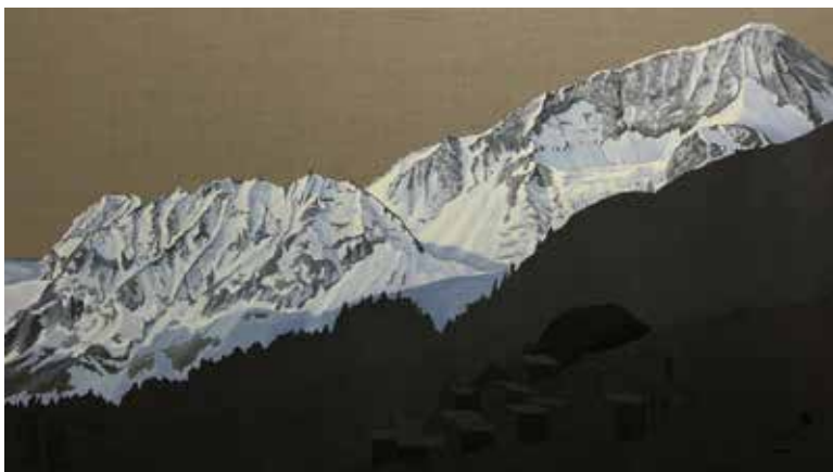
Tôt, le Pigne 2020 - 10.19.2021 Crayon et acrylique sur toile écrue 69 x 123 cm