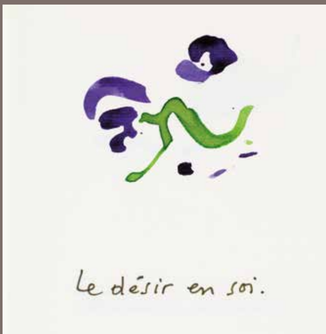
Alexandre Voisard, Le désir en soi , 2003, 13,5 x 9 cm, in : 70 adages et chandelles à l'usage du voyageur solitaire, Livre d'heures, Opus 3. Photographie de Jacques Bélat ©Alexandre Voisard

Exposition du 12 septembre au 22 novembre 2020